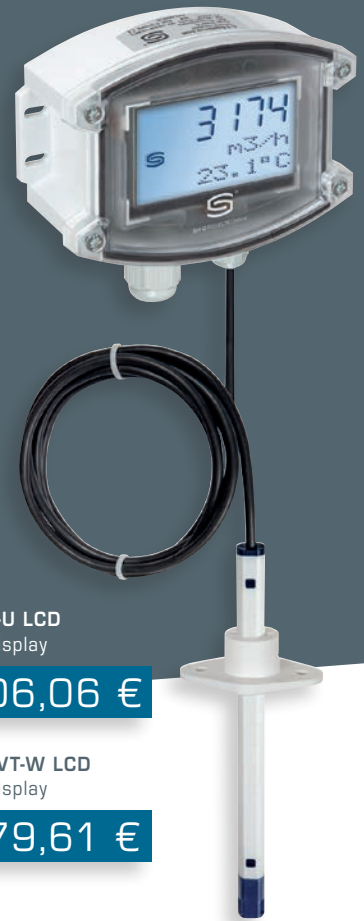
PLGF-U LCD mit Display