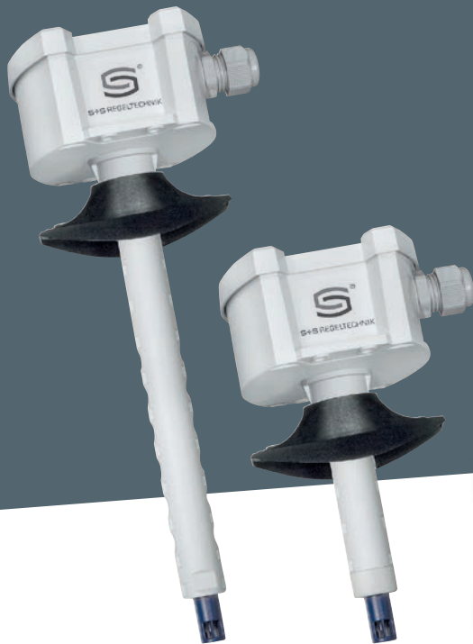
KLGF-U ohne Display