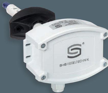
KLSW-W24 ohne Display