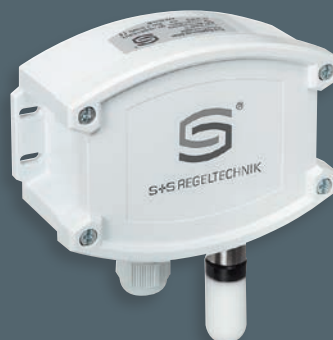
HYGRASGARD® AFF senza display