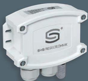
HYGRASGARD® AFTF-Modbus-T3 senza display