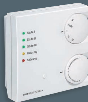
HYGRASGARD® RFTF-Modbus con visualizzazione LED, sensore di presenza, interruttore rotativo e potenziometro