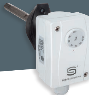
HYGRASREG® KH-10 con regolazione esterna