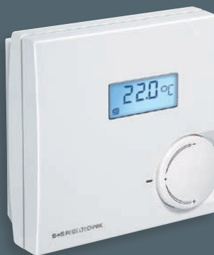
HYGRASGARD® RFTF-Modbus con display e potenziometro