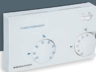
HYGRASREG® RHT con regolazione esterna