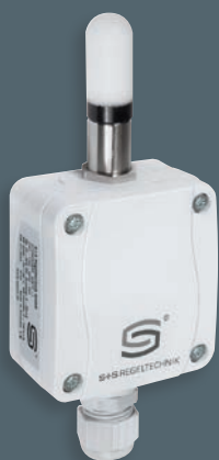
HYGRASGARD® AFF-SD forma compatta, senza display