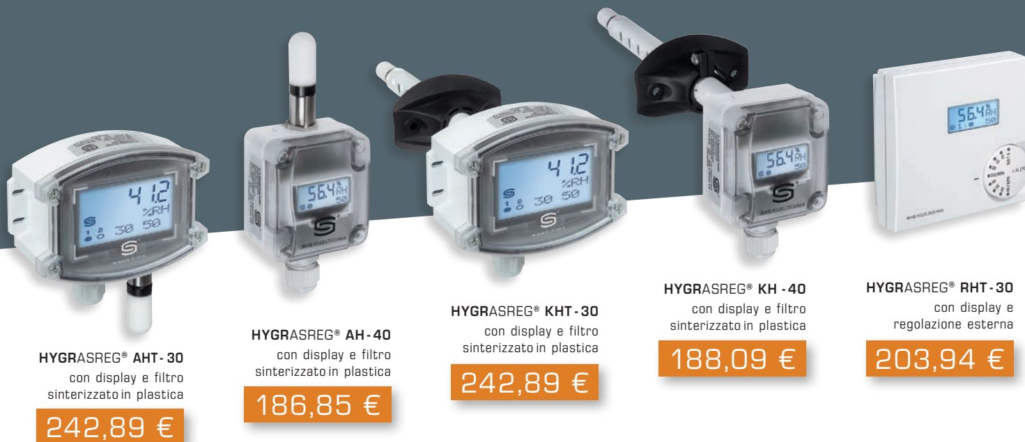
HYGRASREG® AHT - 30 con display e filtro sinterizzato in plastica 242,89 €