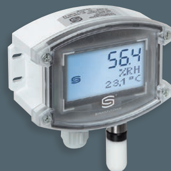
HYGRASGARD® AFF con display