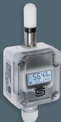
HYGRASGARD® AFF-SD forma compatta, con display