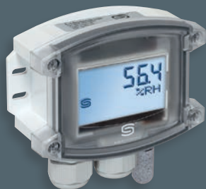
HYGRASGARD® AFTF-Modbus-T3 con display