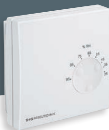
HYGRASREG® RH-2 con regolazione esterna

Per l'impiego in aria non aggressiva, priva di polveri e sostanze nocive