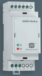
KHSSFV-Modbus Guide profilate