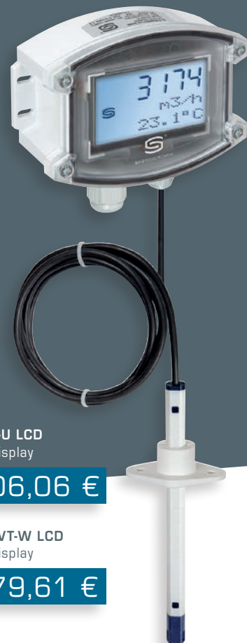
PLGF-U LCD con display