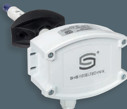
KLSW-W24 senza display