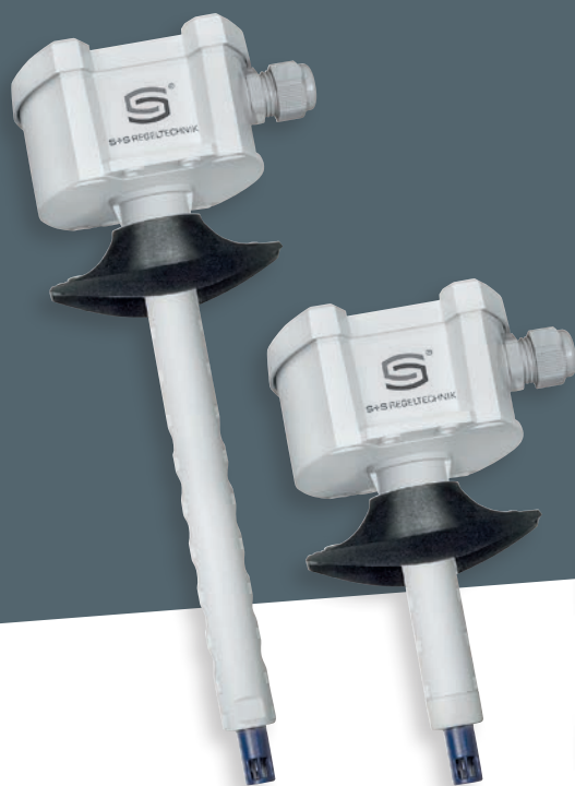
KLGF-U senza display